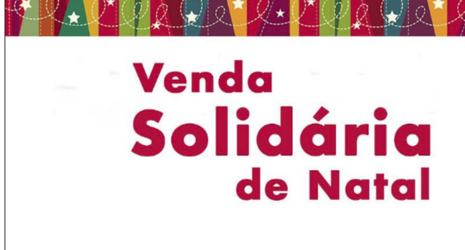
Imagem alusiva à Venda de Natal Solidária

Encontre as suas prendas de Natal enquanto ajuda a Íris Inclusiva!