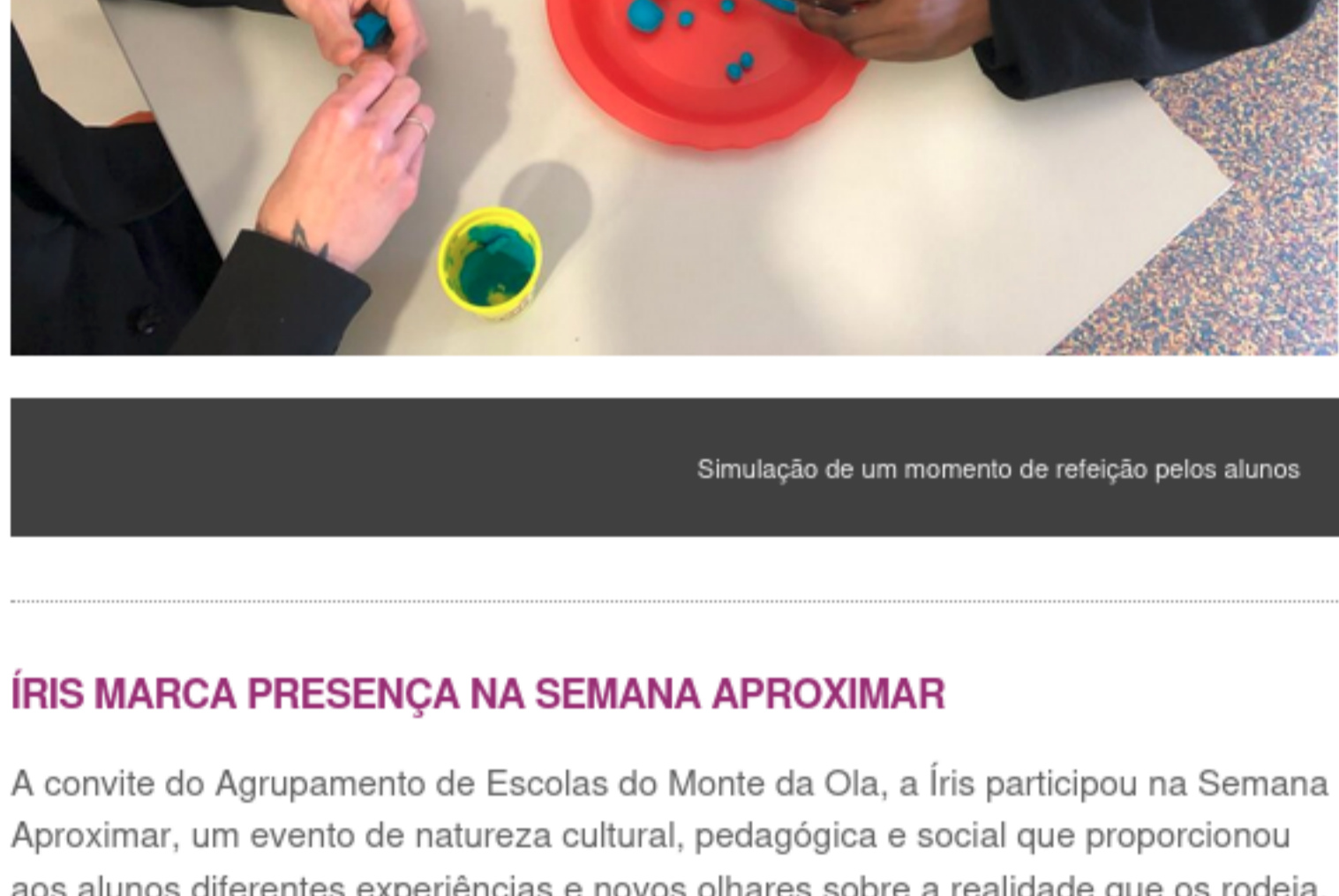
Simulação de um momento de refeição pelos alunos