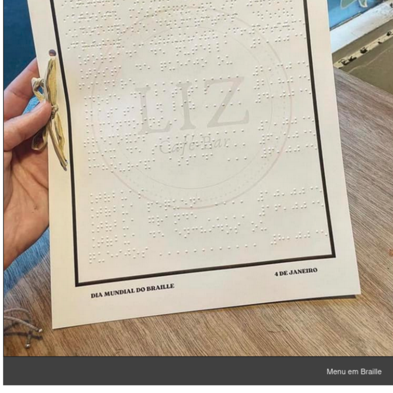
Menu em Braille

Este ano, a Irís Inclusiva assinalou o Dia Mundial do Braille de uma forma diferente, num contexto de recreação noturna. Em parceria com o Liz Caffé Bar, resolvemos surpreender os clientes com um menu impresso em Braille e acompanhar de perto as reações, que não se fizeram esperar! Um fim de dia e início de noite fora do habitual, em que houve oportunidade para responder a questões, satisfazer a curiosidade do público e proporcionar o contacto com a máquina Braille.