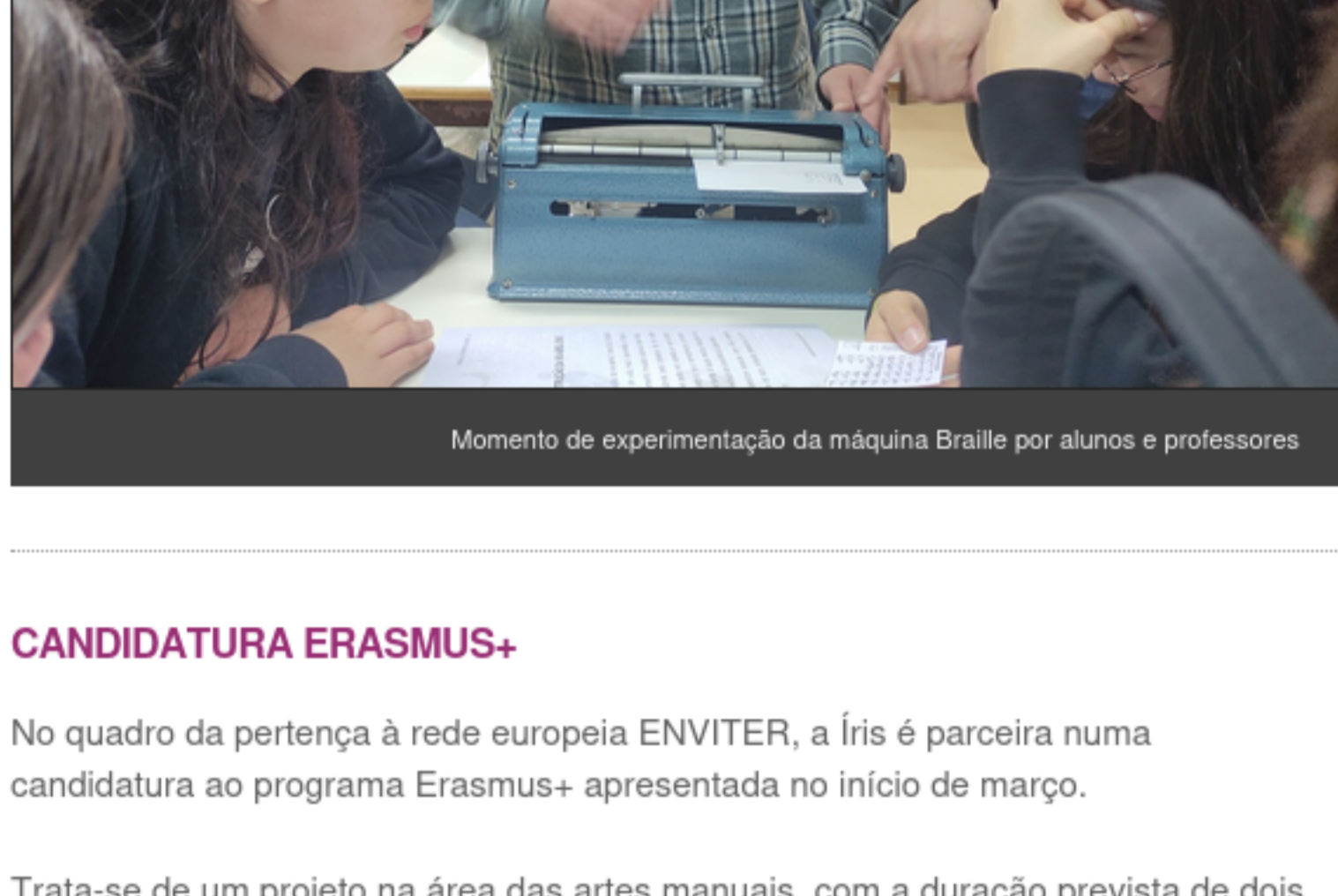
Momento de experimentação da máquina Braille por alunos e professores

A convite do Agrupamento de Escolas do Monte da Ola, a Irís participou na Semana Aproximar, um evento de natureza cultural, pedagógica e social que proporcionou aos alunos diferentes experiências e novos olhares sobre a realidade que os rodeia. Foram quatro as sessões dinamizadas ao longo da manhã do dia 7 de fevereiro, na Escola da Foz do Neiva, desafiando alunos do 3.º ciclo de escolaridade a cooperar na resolução de uma tarefa de transcrição de Braille.