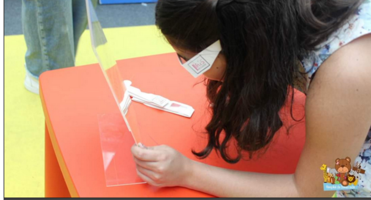
Criança tenta ler com os óculos, identificados com o logo da Íris Inclusiva

Na sala de espera deste "hospital", as crianças puderam explorar a envolvente usando os nossos óculos, que simulavam uma condição de baixa visão.