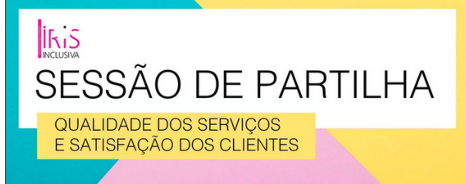
Sobre um fundo em três cores, caixas de textos com o nome da atividade

Nesta sessão, pretende-se recolher opiniões, críticas e sugestões de melhoria do trabalho desenvolvido pela Instituição.