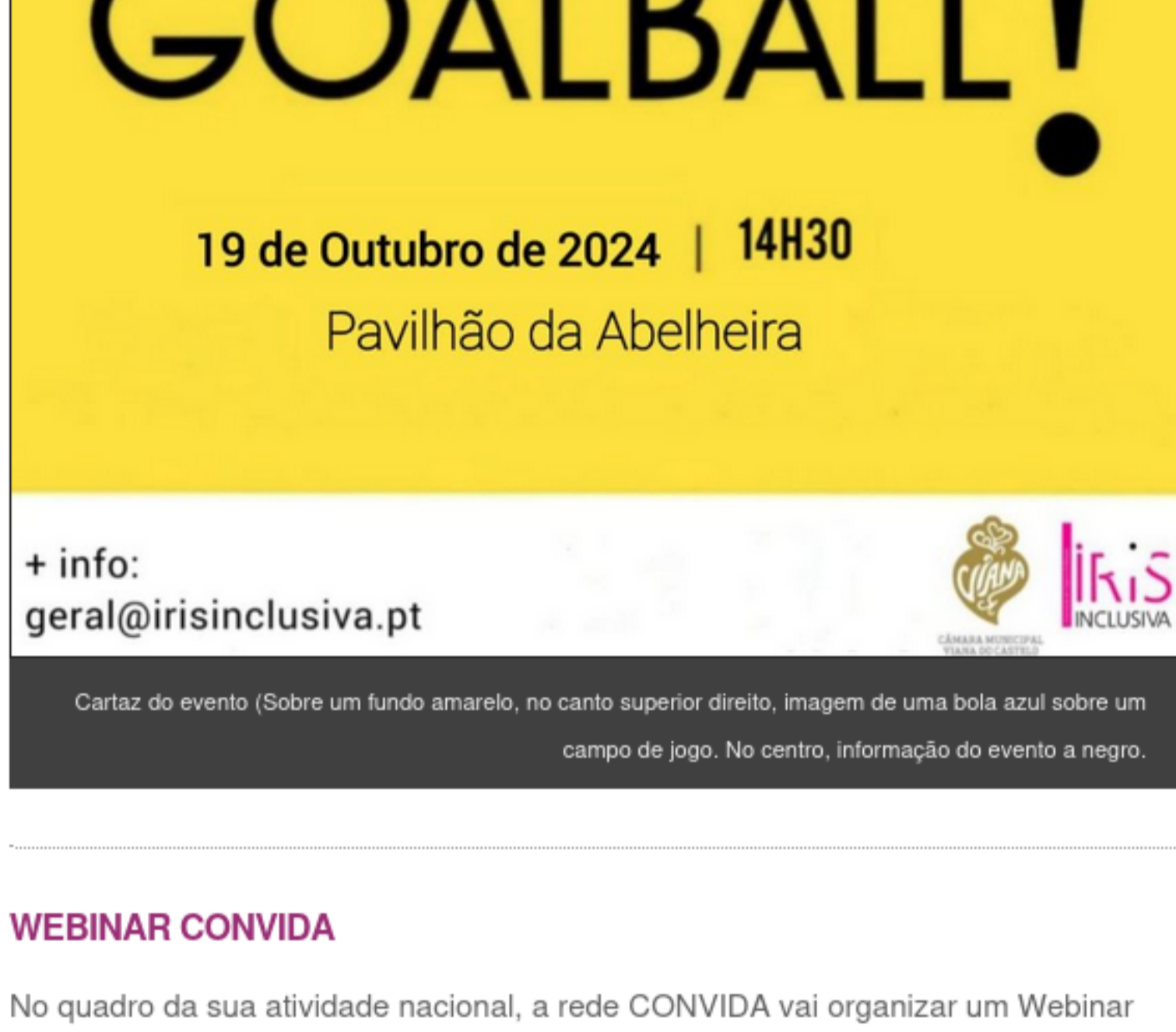
Cartaz do evento (Sobre um fundo amarelo, no canto superior direito, imagem de uma bola azul sobre um campo de jogo. No centro, informação do evento a negro.

É já amanhã, dia 19 de outubro, que a Irís promove mais um treino de Goalball aberto à comunidade, desta vez no Pavilhão da Abelheira. A partir das 14h30, só tem que aparecer, seja para conhecer, para experimentar ou para praticar!