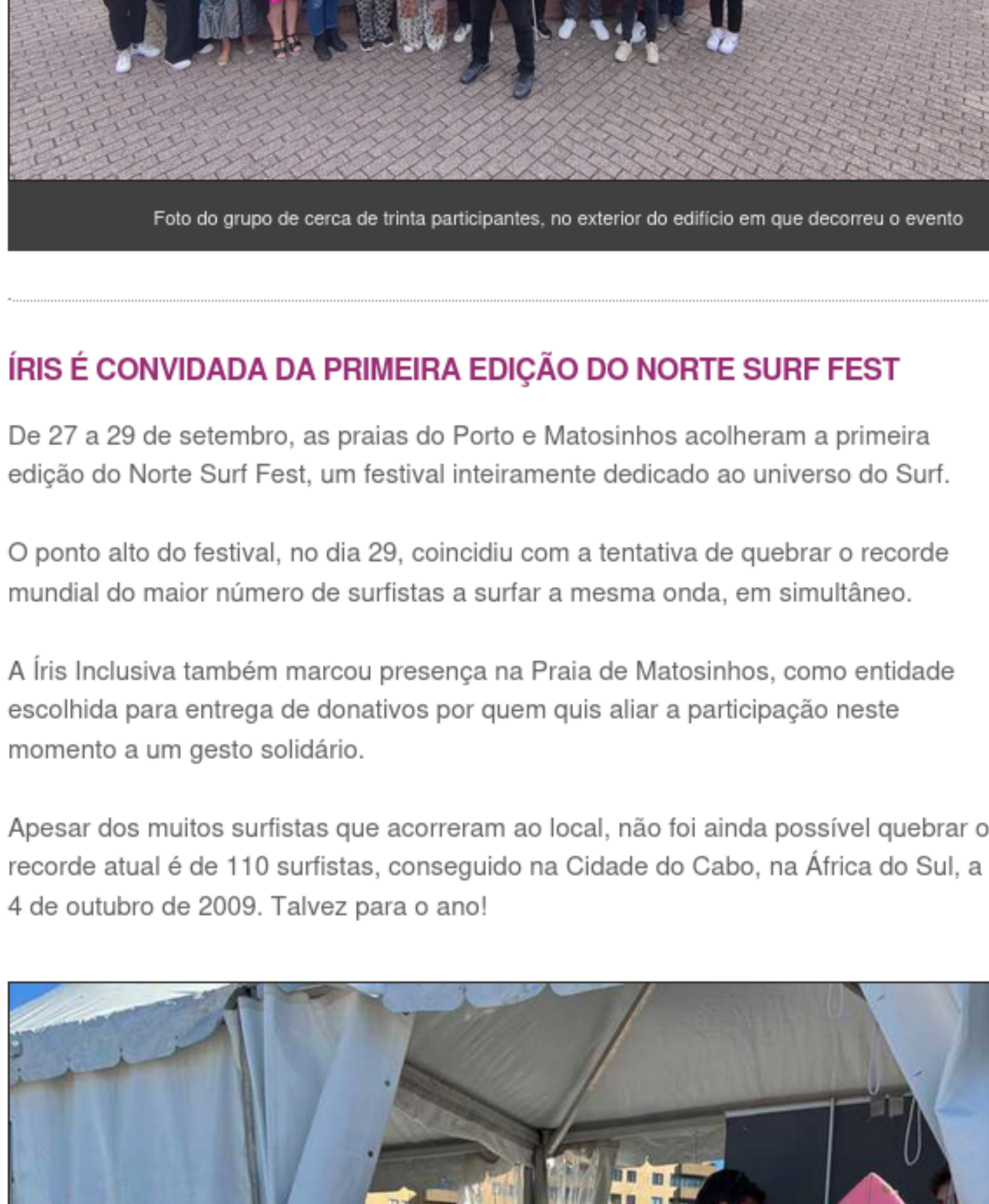
Foto do grupo de cerca de trinta participantes, no exterior do edifício em que decorreu o evento

Foram dois dias intensos de partilha de ideias e de desenvolvimento de propostas de projetos para candidatar no futuro, que contaram com a participação de 21 membros desta rede europeia de organizações com intervenção na área da deficiência visual.