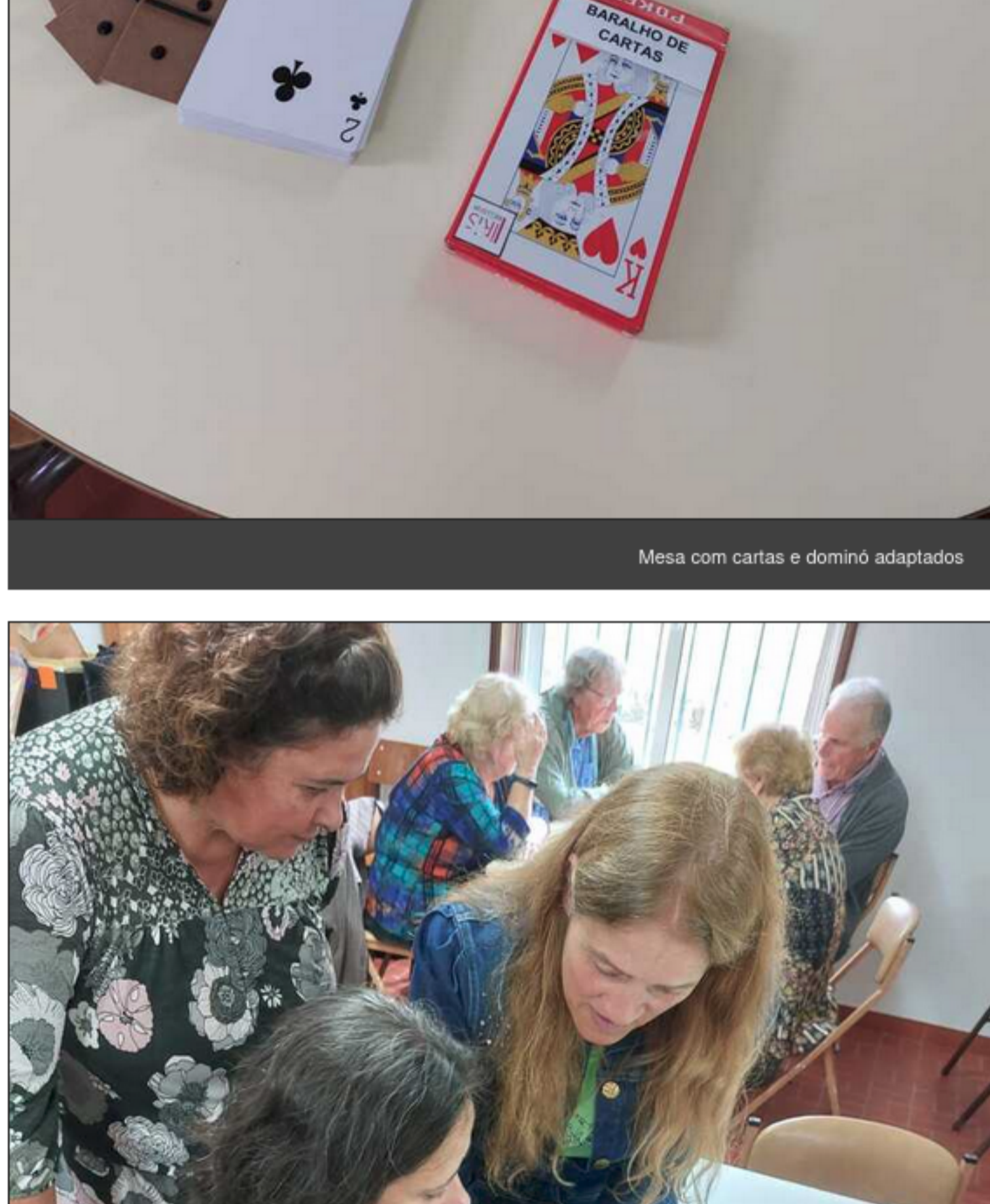
Dois pessoas com vendas experimentam jogo do galo adaptado

Obrigada, AFS, pelo caloroso acolhimento!