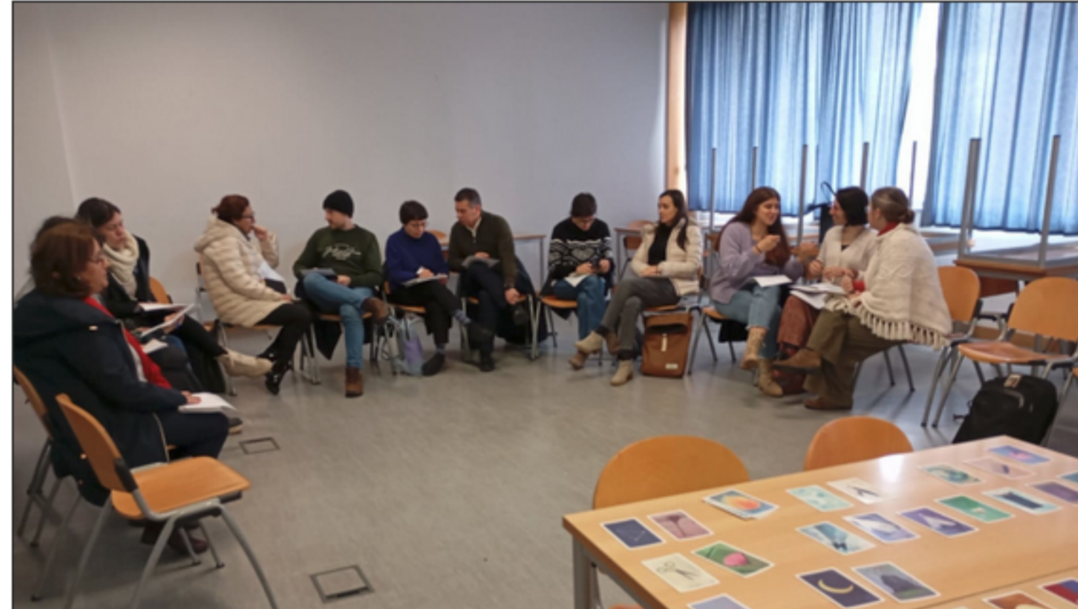
Vista geral dos participantes na sessão informativa

No dia 21 de janeiro, a Íris participou na primeira sessão de formação para agentes educativos em ED que o Núcleo Escolas Transformadoras da Escola Superior de Educação de Viana promoveu este ano letivo. Uma oportunidade para aprofundar a reflexão sobre o tema da cooperação entre as instituições de ensino superior e as organizações da sociedade civil.