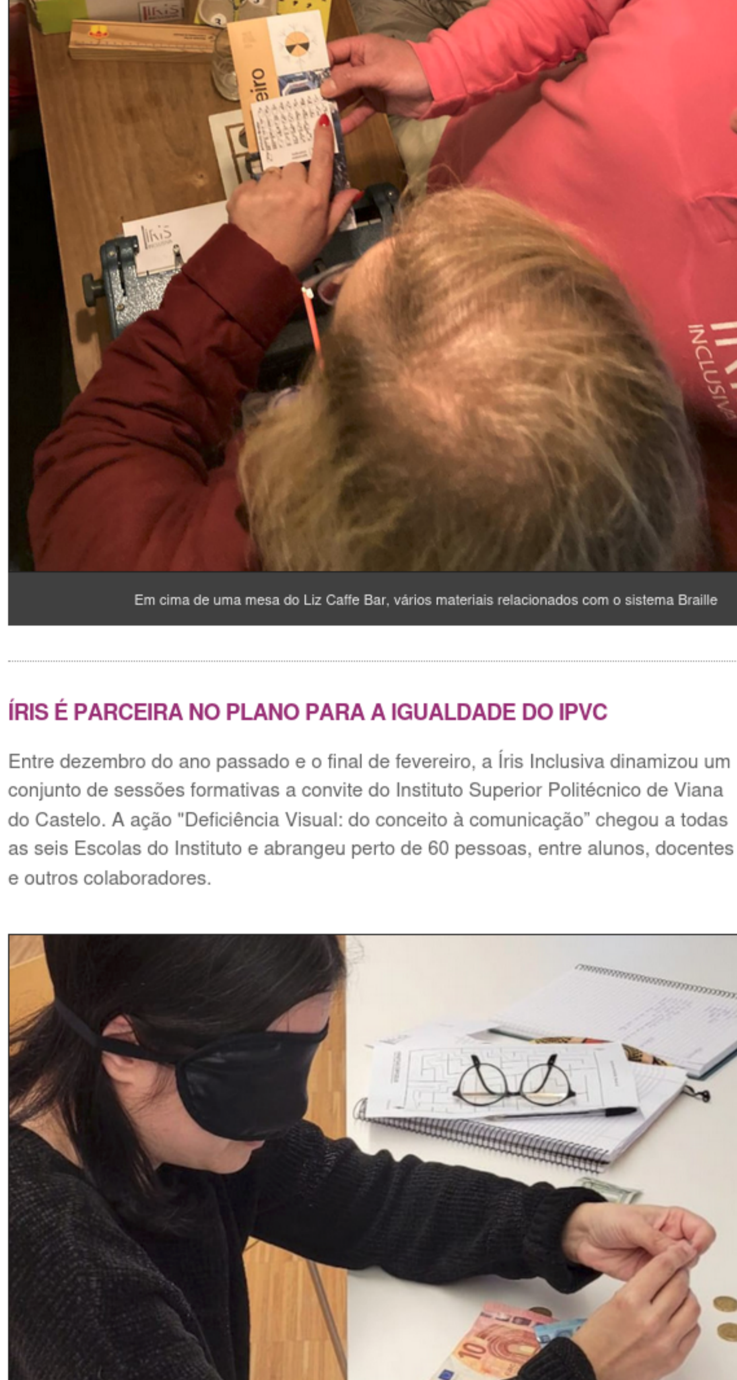
Em cima de uma mesa do Liz Caffé Bar, vários materiais relacionados com o sistema Braille

No dia 4 de janeiro celebra-se o Dia Mundial do Braille. Este ano, a Íris Inclusiva assinalou a data no Liz Caffé Bar, produzindo ementas em Braille e disponibilizando, no local, vários recursos relacionados com este sistema de leitura e escrita.