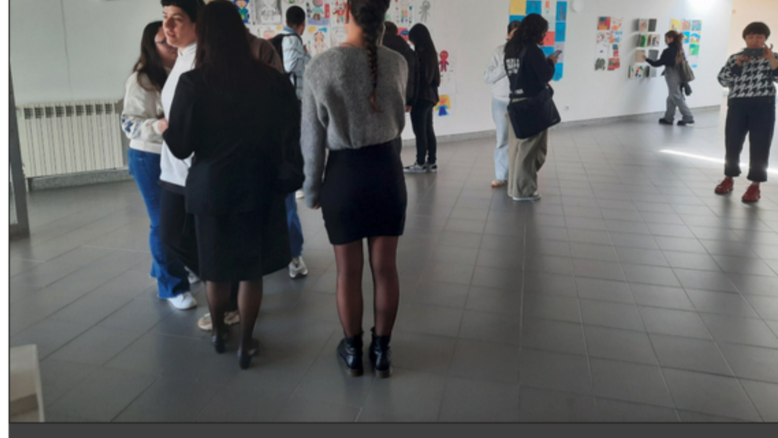
Vista geral do espaço que acolhe a exposição.

A exposição, que conta com o apoio da Oficina Cultural do SAS-IPVC, estará patente até 27 de março.