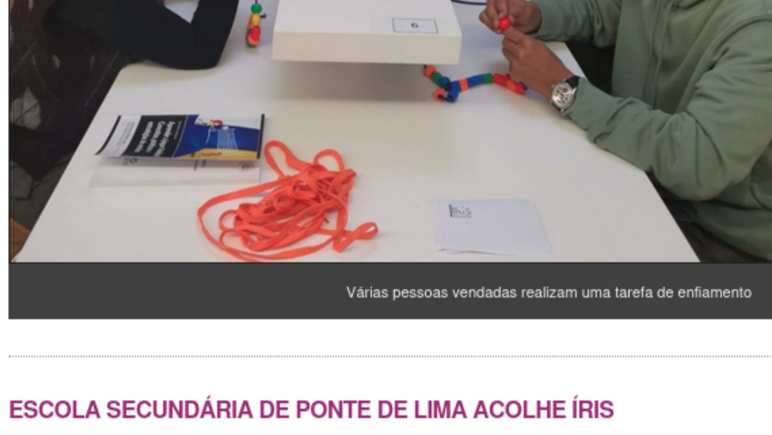
Várias pessoas vendadas realizam uma tarefa de enfiamento