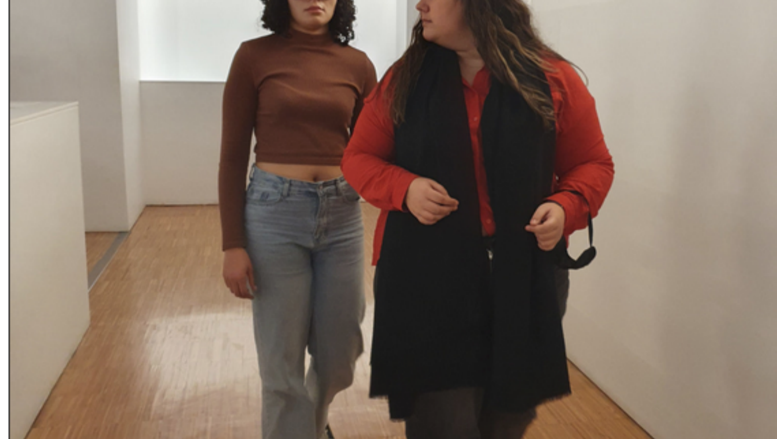
Prática simulado de técnicas de guia