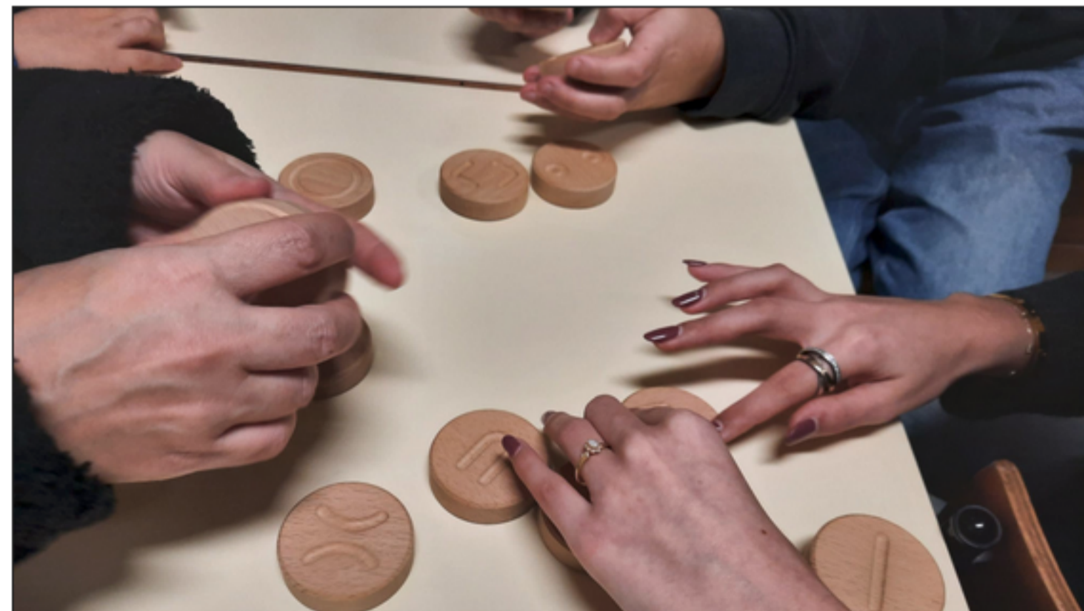
Em cima de uma mesa, alunos exploram peças de madeira com inscrições em baixo relevo

A Íris Inclusiva tem vindo a dinamizar algumas sessões formativas com alunos do mestrado em Design Integrado da Escola Superior de Tecnologia e Gestão. Este trabalho colaborativo surge no quadro de um desafio lançado aos alunos, de produção de recursos para utilização em contexto de treino de orientação e mobilidade.