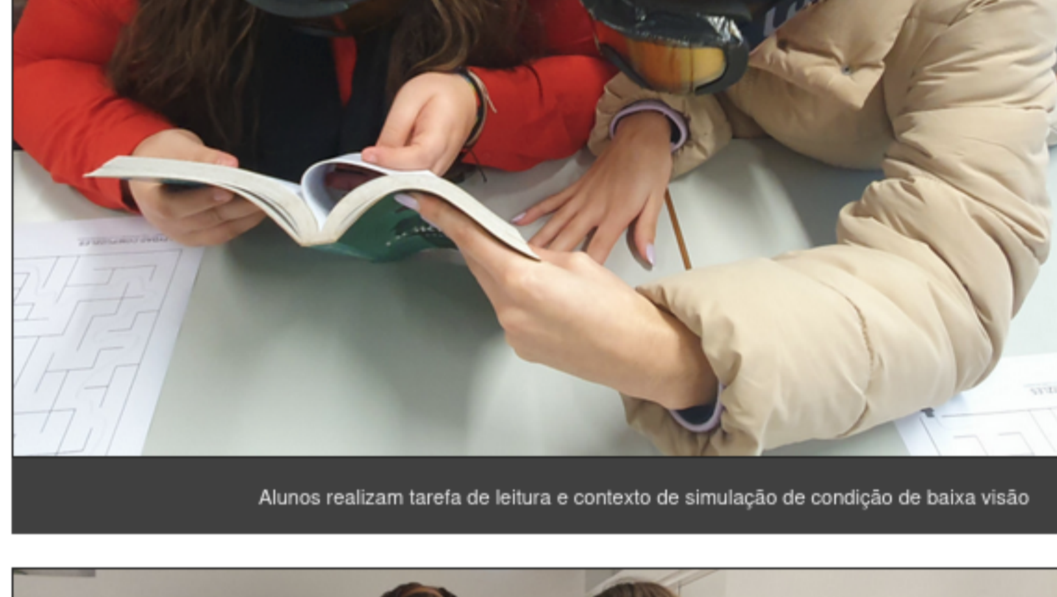
Alunos realizam tarefa de leitura e contexto de simulação de condição de baixa visão

Como vem sendo habitual, a Íris promoveu uma sessão formativa na Escola Secundária de Ponte de Lima, dirigida aos alunos do 12.º ano do Curso Profissional de Técnico Auxiliar de Saúde. Durante uma manhã, foi possível explorar recursos relacionados com a intervenção nesta área e o desempenho de funções de atendimento.