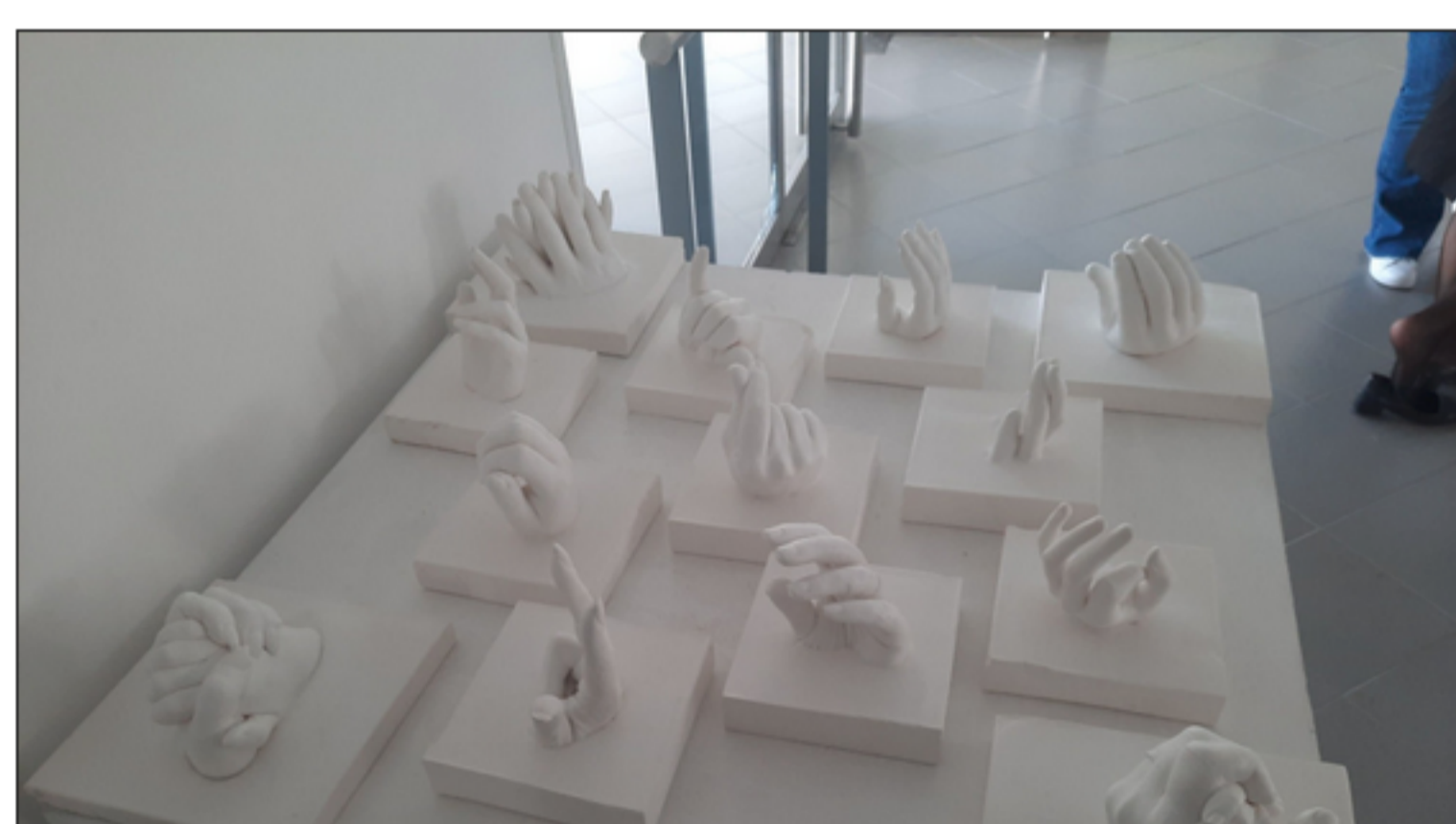
Diversas mãos em gesso em cima de uma mesa